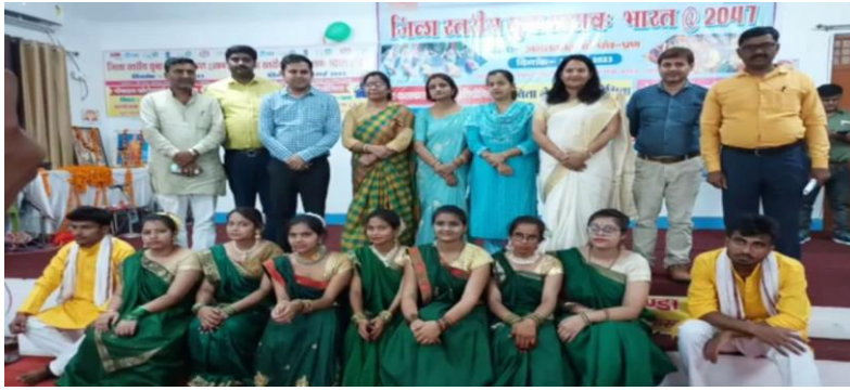
सांस्कृतिक कार्यक्रम में प्रतिभाग किए हुए सफल छात्र एवं अतिथिगण