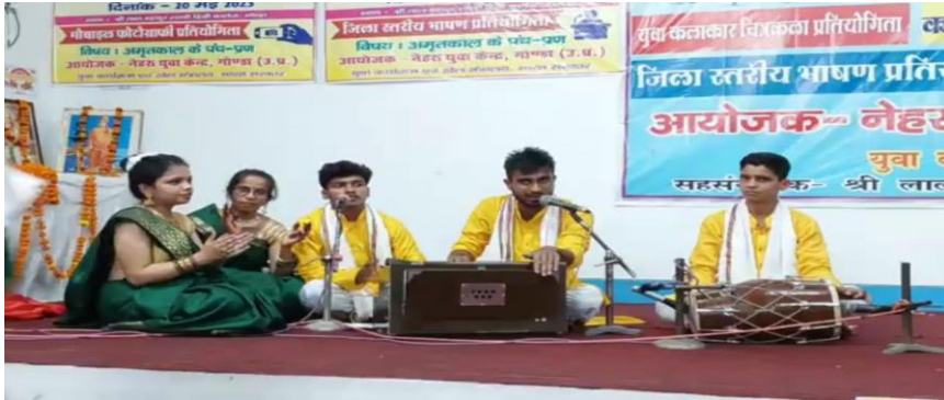
लोकगीत प्रस्तुत करते हुए छात्र एवं छात्राएं