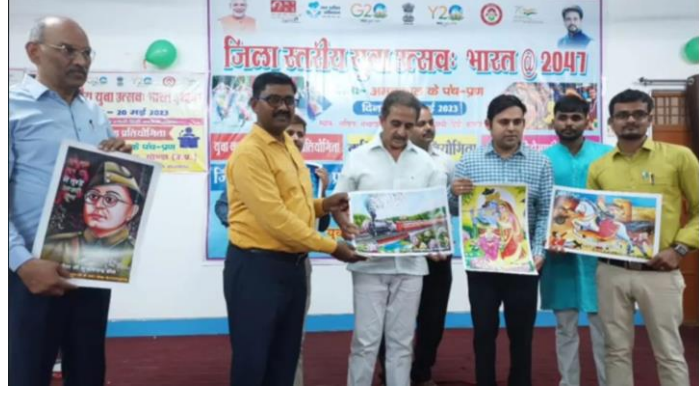
उपस्थित मंचासीन अतिथिगण एवं प्राचार्य