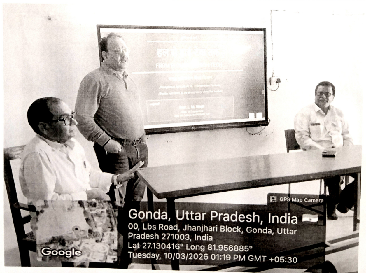
Gonda, Uttar Pradesh, India 00, Lbs Road, Jhanjhari Block, Gonda, Uttar Pradesh 271003, India Lat 27.130416° Long 81.956885° Tuesday, 10/03/2026 01:19 PM GMT +05:30