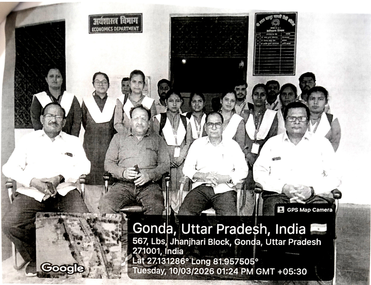
Gonda, Uttar Pradesh, India 567, Lbs, Jhanjhari Block, Gonda, Uttar Pradesh 271001, India Lat 27.131286° Long 81.957505° Tuesday, 10/03/2026 01:24 PM GMT +05:30